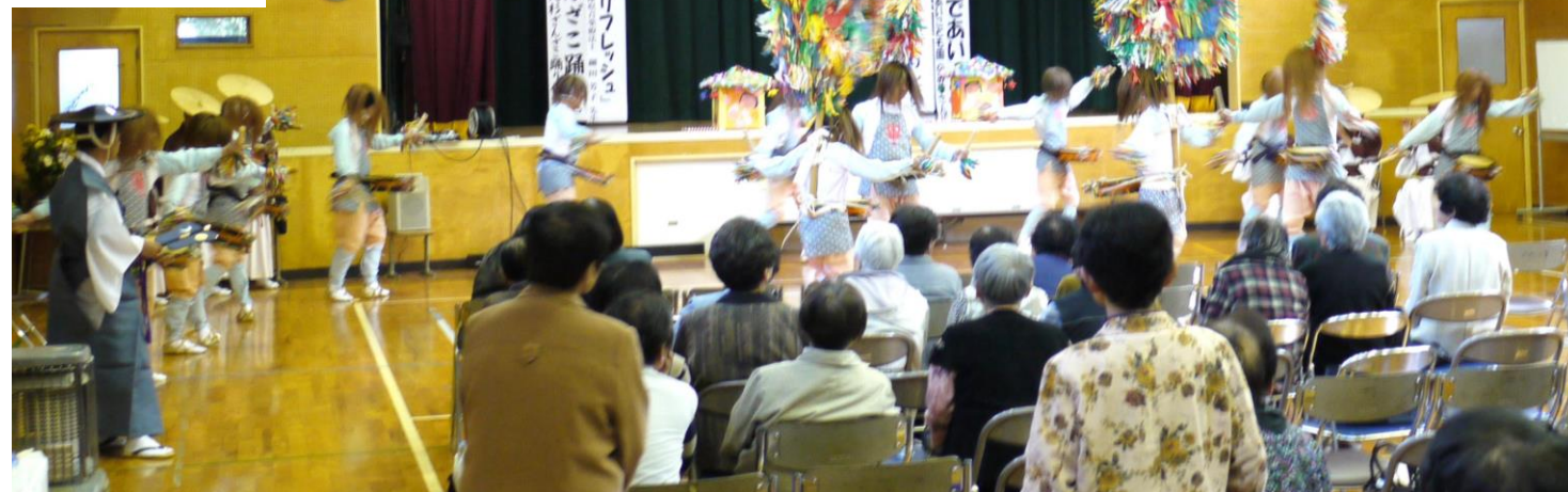
県指定無形民俗文化財「大杉ざんご踊り」360余年も続けられている伝統ある民俗芸能はさすがに立派