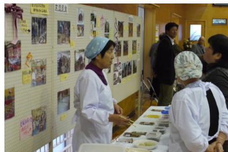
加工品試食コーナー「お味はいかが?」

出合校協展示〔各部会展示 70点〕避難所の簡易ベッド他、活動紹介写真、粘土作品、加工品写真と原材料紹介