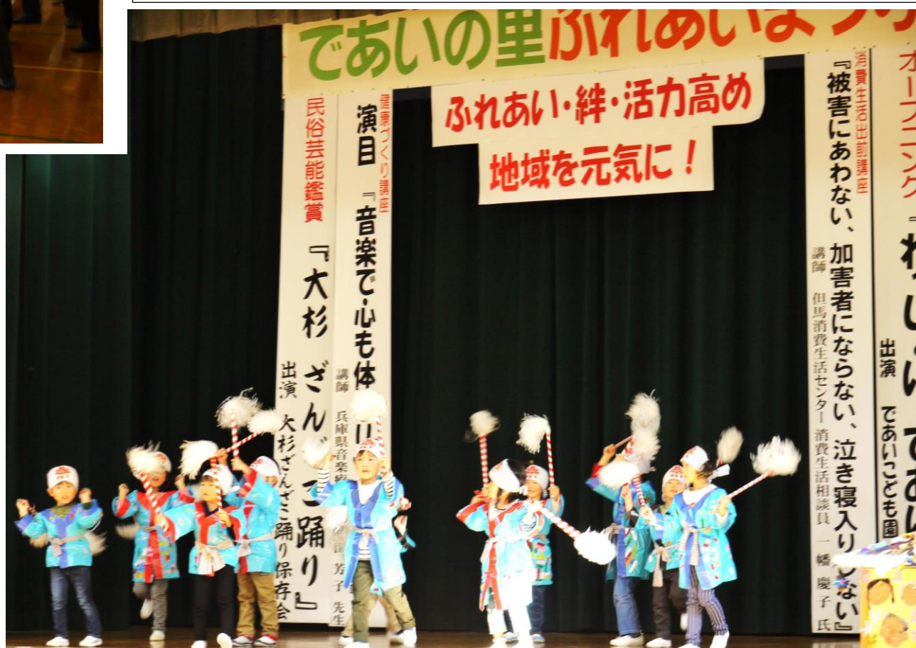
午後のオープニングは出合こども園の「わっしょい であいつこ」元気なかけ声が聞こえていました。

作品展示 団体〔2グループ〕手芸サークル 45点、タペストリー、布バック、置物、ストールほか 出合こども園「なかよしせいさく」一式