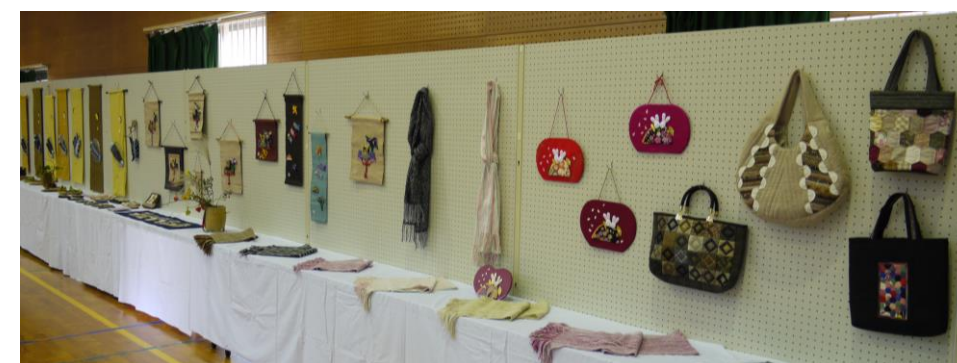
展示作品コーナーには素晴らしい手芸作品、書、俳句など日頃の成果が並びました。