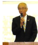
来賓としてお越しいただきました 広瀬市長と勝地議長におことばをいただきました。