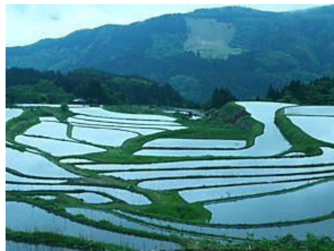
別宮の棚田は、氷ノ山をバックにした棚田写真の絶好のスポットとなっています