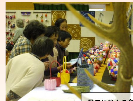
展示に見入る参加者(昨年)

2014/10/10 No.57 出合校区協議会 (電話)667-8020 (Fax) 667-8022