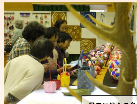
展示に見入る参加者(昨年)

2014/10/10 No.57 出合校区協議会 (電話)667-8020 (Fax) 667-8022