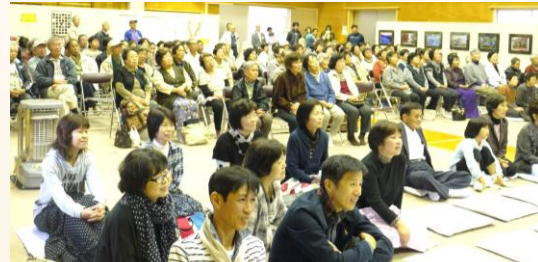
昨年の講演会の様子