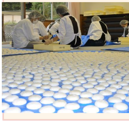
秋まつり注文のもちづくりの様子 「十八日も美味しい餅を拾いに来よう」