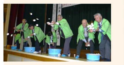
最後は、協議会設立5周年記念のもちまきで楽しんでいただきました。それぞれ景品交換して帰路につきました