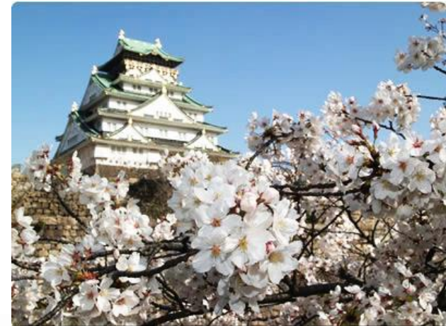
重要文化財に囲まれた西の丸庭園は、公園内の約1270本の梅の花が咲き誇る梅林とともに、ソメイヨシノを中心に約3000本の桜の名所として、人々の人気を集めています。例年の桜の見頃は3月下旬から4月上旬。

【と き】3月29日(日) であいの里 7時出発 18時30分帰着予定 【行 先】大阪城公園(お花見ウォーク)、神戸市酒心館 【会 費】1人4,000円、小学生以下3,500円 (お弁当・お茶つき) 【申 込】2月27日(金)17時までにであいの里へ申込書を提出してください。 電話でも受け付けます。