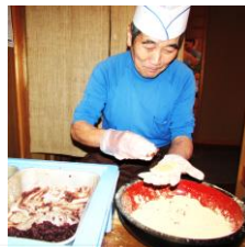
「ぼたもち」見事な手さばきに見とれてしまいました

その後、久美浜町の道の駅と豊岡市のたじまんまで餅等の加工品やシールを調査し、加工品づくりに活かしていきたいと思えます。(すずめの学校)