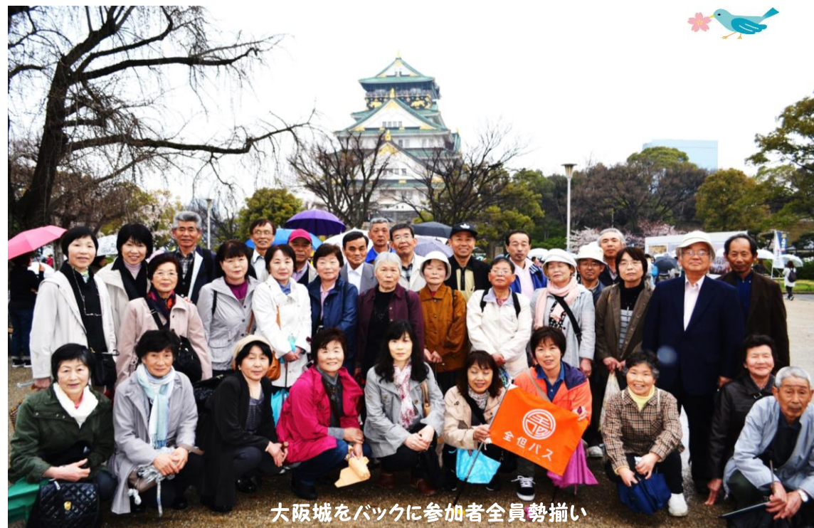
大阪城をバックに参加者全員勢揃い

3月最後の日曜日、大阪城公園の桜は三分咲きといったところでした。あいにくの小雨模様であり周辺を歩くには少々足元が悪く全員で天守閣に上ることにしました。(勿論靴で) 大阪の街並みを見渡し城内の展示品を見学、その後、大阪空港で買物やお茶をしているとあっという間に時間が過ぎてしまいました。神戸酒心館ではお酒造りの工程のビデオ鑑賞、工場見学の後、お酒の試飲やお買物を楽しみました。「そうこういいながらも1万歩以上歩いたわ」「やっぱり吟醸酒がうまいなあ、自分のおみやげにも……」帰りの車中はカラオケが始まり交流と親睦の花が咲きました。