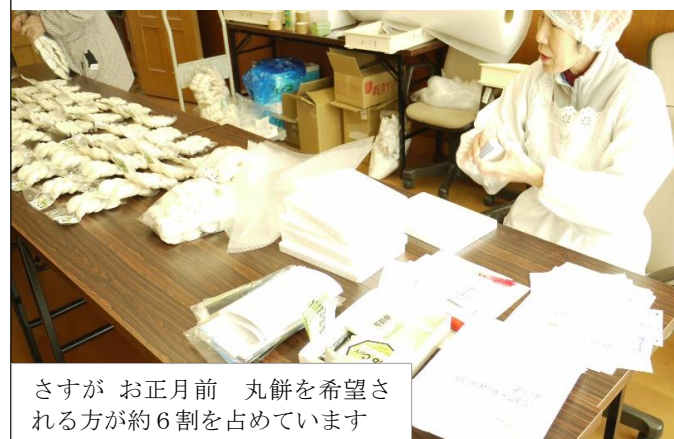
さすが お正月前 丸餅を希望される方が約6割を占めています

養父市が推進する「ふるさと納税」制度が徐々に浸透しています。平成29年1月現在で、養父市へのふるさと納税申込は、約7,400件、約2億4千万円に達しました。前年比約5倍強の勢いです。養父市が取り組むこの制度の返礼品に出合校区協議会「であいの里ふるさと特産品」が選ばれ、昨年11月から本年の正月にかけて納税者に「丸餅セット」「漬物、佃煮セット」など163件を全国各地(沖縄から北海道まで)に送っています。 この際、「であいの里のパフレットや特産品のリーフレット」なども同封しピーアールに努めています。 養父市では、この寄付金を有効に役立てるため、平成29年度予算に反映し、元気なふるさとづくりを進めるとのことです。 29年のスタートにあたり、全国の養父市ふるさと納税応援者の方々に喜んでいただける商品づくりに今後も精進したいと思っておりますので、校区の皆様方や農産物を提供いただける方々のご協力をよろしくお願ひいたします。