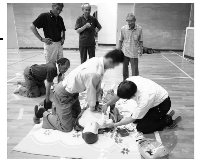
[講師] 養父消防署職員

〔と き〕 6月24日(土) 夜 7時30分~9時 〔ところ〕 出合コミュニティスポーツセンター 体育館 〔内容〕 心肺蘇生法、AEDの使用法 ほか