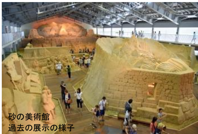
砂の美術館 過去の展示の様子

〔行先・行程〕 鳥取県 であいの里 8:00 ⇒ 海と大地の自然館 9:10~10:00 ⇒ 砂の美術館 10:20~11:10 ⇒ 賀露港にて昼食 11:30~12:30 ⇒ 燕趙園(雑技ショー見学・庭園散策) 13:10~14:30 ⇒ 倉吉白壁土蔵散策 14:50~15:50 ⇒ 元帥酒造製造場(見学・試飲・お買物) 16:00~16:40 ⇒ 道の駅きなんせ 17:55~18:10 ⇒ であいの里 19:20 (時間は多少変更する場合があります。)