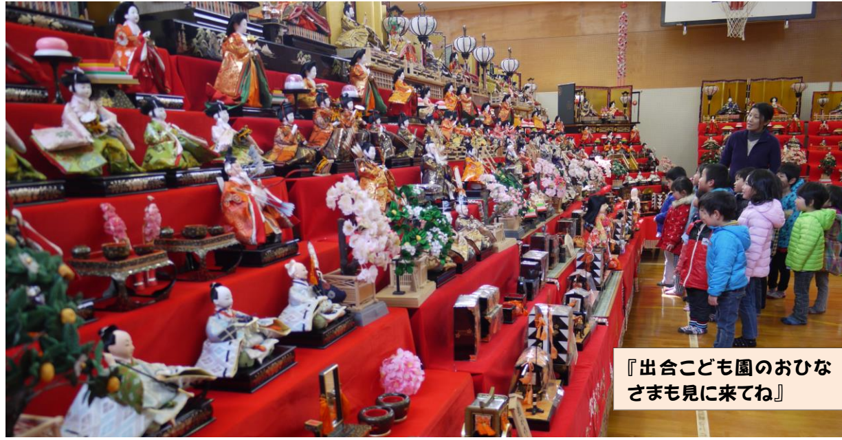
『出合こども園のおひなさまも見に来てね』

3月3日から“であいの里ひなまつり”が始まりました。 ようやく飾りつけを終えた2日のお昼頃に、朝日新聞と毎日新聞の記者が取材に来られました。 朝日新聞には七段飾りのおひなさまをバックにお気に入りの葛畑土人形を持った女性陣、記者曰く“であいのおばあ”の写真が、また、毎日新聞には出合こども園の園児たちの見学風景の写真が、記事とともに初日の3日に掲載されました。9日には神戸新聞掲載。3月10日～16日養父市ケーブルテレビ放映。おかげで初日から、市内外の大勢の方々にお越しいただき連日賑わっています。 3月18日は10時開演で、たんたん落語会の3名の落語家をお招きして“ひなまつり寄席”をお楽しみいただきます。 今回は、送迎車を運行することにしました。どうぞご利用いただき楽しいひとときをお過ごしください。[担当：文化部会 他]