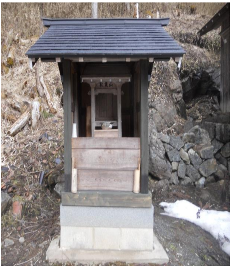
神社横に移築され、祀られている秋葉山(秋葉神社)

川原場地区の秋葉山は、明治24年(1891年)の4月16日に大火災が発生し、村中及び神社、南北山林に至るまですべて焼失したために村人が相談し、明治30年(1897年)の6年後の4月に向山で村がすべて見渡せる所に秋葉神社をお祀りしました。 しかし、近年高齢化のために足場も悪くお参りする事が難しくなりました。 平成26年(2014年)に117年を経て地区民総出で、地区の神社横に下山させて頂き移築しました。 今では地区民(高齢者)もお参りする事が出来る様になり、大変喜んでおります。 以前は、火災のあった4月16日に火災から地区を守って頂く様に秋葉山の神事を行っていましたが、近年は地区民の方々が勤務の関係もあり4月の1～2週目の土曜日に神事を行っています。 ちなみに、川原場の名前の由来は川原に形成された村の事の様であり、古くは外野の支村(分村)の様です。