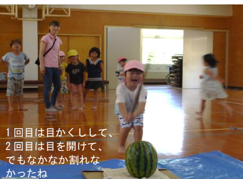
1回目は目かくして、2回目は目を開けて、でもなかなか割れなかったね

同時開催の幼児を対象にしたスイカ割り大会には出合こども園をはじめ、地域の子どもたち10余名が参加してくれました。スイカ割りの後は、冷やしたスイカを来場者の皆さんとともにいただきました。