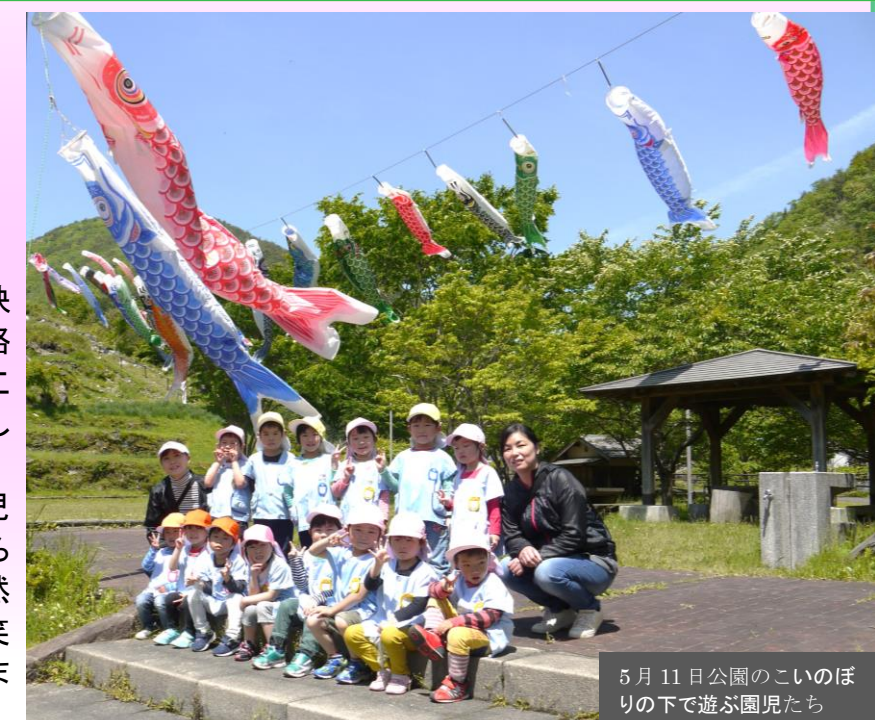
5月11日公園のこいのぼりの下で遊ぶ園児たち