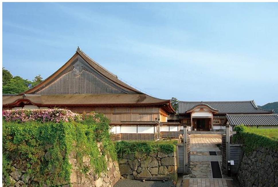
写真は 篠山城跡 大書院