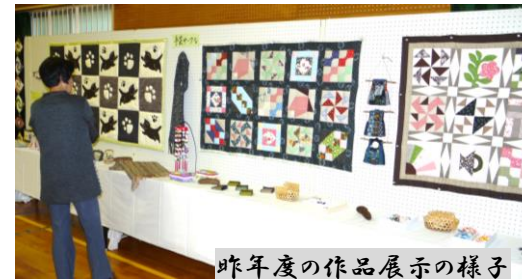
昨年度の作品展示の様子

ふれあいまつりに展示する作品を募集します。これから手掛けても大丈夫、まだ間に合います。あなたの力作をぜひ展示させてください。手づくり作品以外でも皆さんにご披露していただけるものがありましたら展示してください。