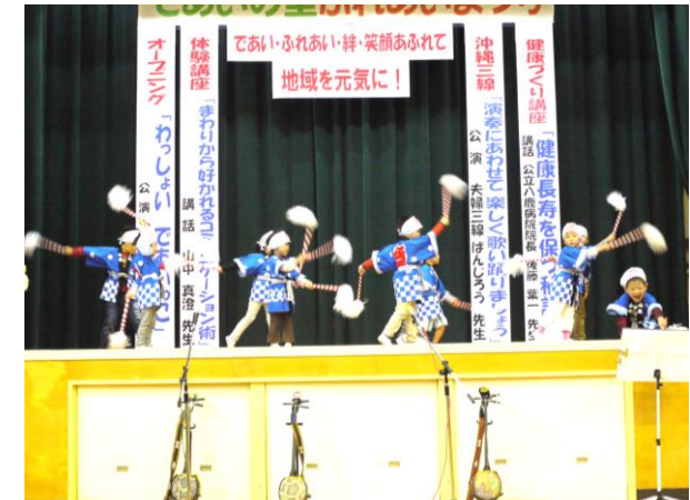
昨年度の出合こども園の演技の様子