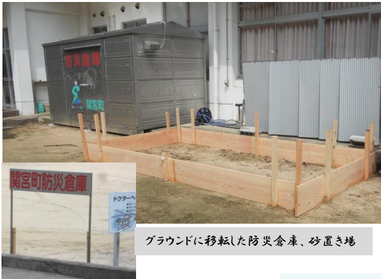
グラウンドに移転した防災倉庫、砂置き場

出合バスターミナル付近に設置されていた養父市の防災倉庫及び土嚢用砂置き場を出合コミュニティスポーツセンター西玄関よりのグラウンドに移設しました。