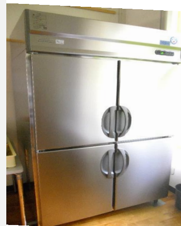
冷凍庫 主に餅を冷凍します