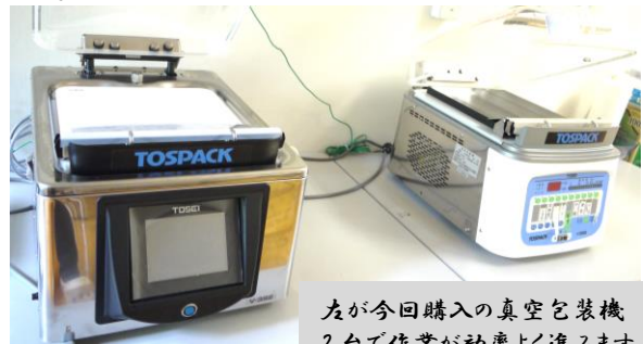
左が今回購入の真空包装機 2台で作業が効率よく進みます

冷凍庫は原材料や加工品の保存に、真空包装機は、餅、漬物の包装を効率的に進めます。今後も加工品の生産量の増大を目指していきます。 (担当:加工部会)