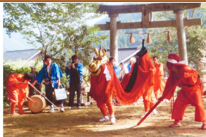
《麒麟獅子舞のルーツ》

現在は、春祭りは4月の第3日曜日、秋祭りは9月19日の年2回、家内安全、無病息災、五穀豊穡を祈願し全戸を練り歩いている。