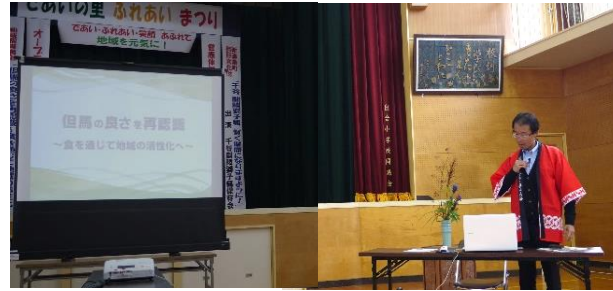
「但馬は食材の宝庫、地域資源を活かした地域づくりを！」