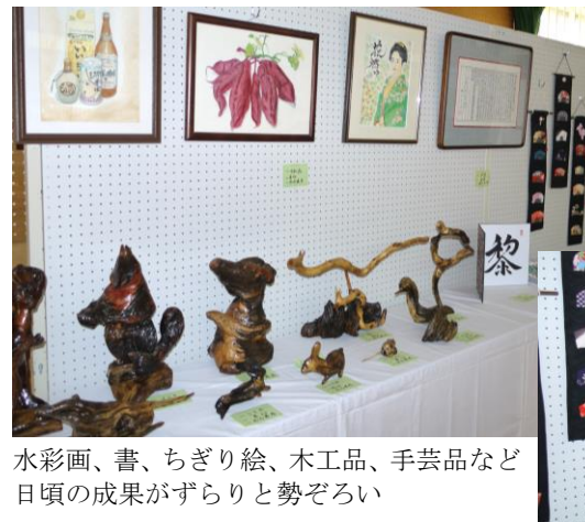
水彩画、書、ちぎり絵、木工品、手芸品など日頃の成果がずらりと勢ぞろい