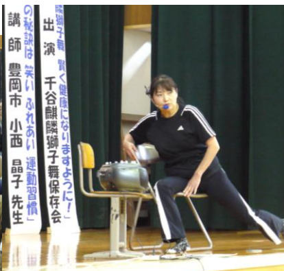
「毎日続けましょう！」