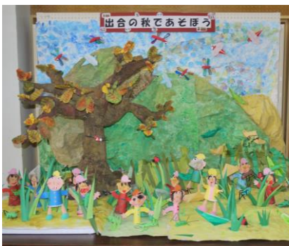
出合こども園「出合の秋であそぼう」