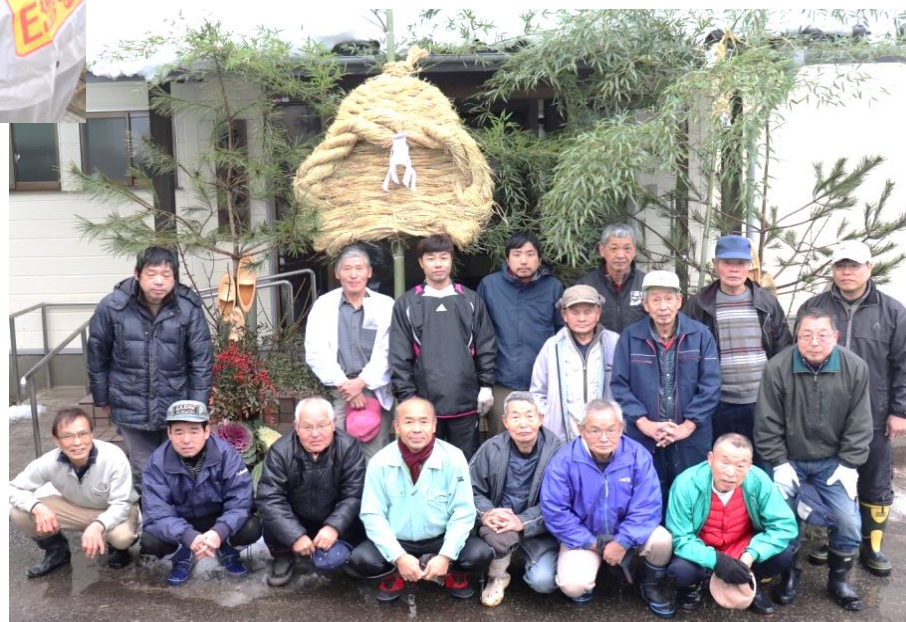
門松飾り(公会堂)の前で 大草履つくりに参加した区民「今年も元気で暮らせませう