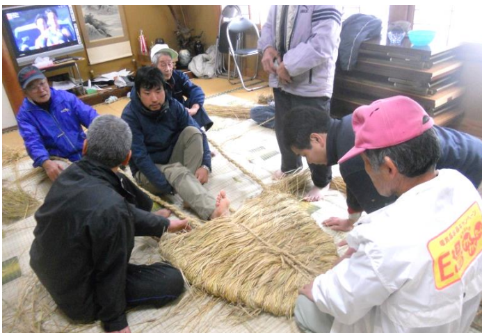
大きさ、厚み、形を調整しながら作り上げま

年々地区民が高齢化している中で材料の確保や技術の継承が課題ですが、村人の総力を挙げて伝統行事を守っています。この大草履と子草履は、近くの志賀峰神社に奉納された後、6日(日)どんどの日の夜、安井区と出合区の村境(オの木)に、地区の厄除けと平穏を祈願して祀ります。