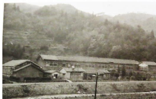
改築前の昭和30~40年代の頃の出合小学校 (現建物は昭和52年建築)

出合小学校はなくなり関宮小学校、関宮中学校の校歌も代々変わっています。一部資料 関宮学園提供