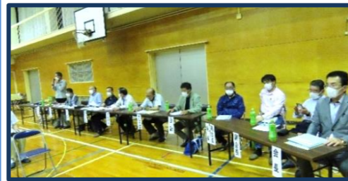
新役員から令和5年度事業計画案を提案