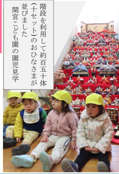
階段を利用して約百五十体（十セツ）のおひなさまが並びました 関宮こども園の園児見学