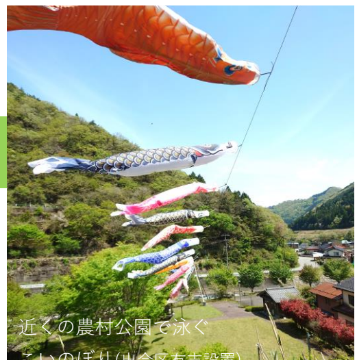
時代を反映した勇壮な絵柄の幟は 見ごたえがあります (写真は昨年の風景)