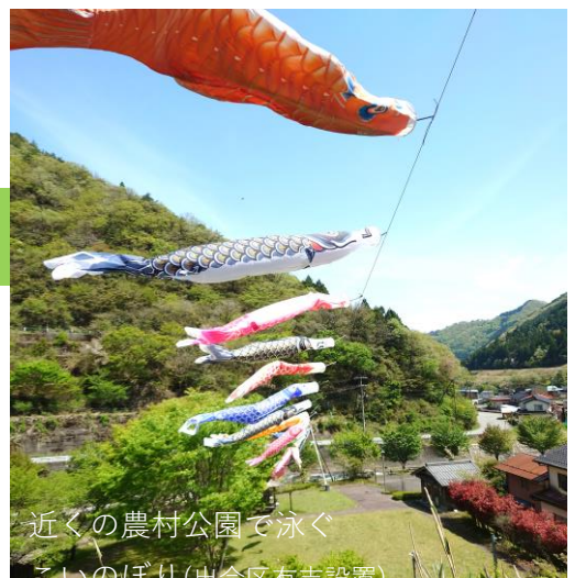
時代を反映した勇壮な絵柄の幟は 目撃者がありまよ (写真は昨年の風景)