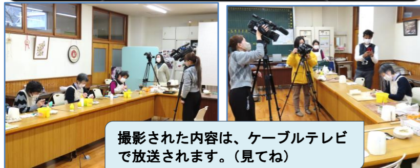
撮影された内容は、ケーブルテレビで放送されます。(見てね)