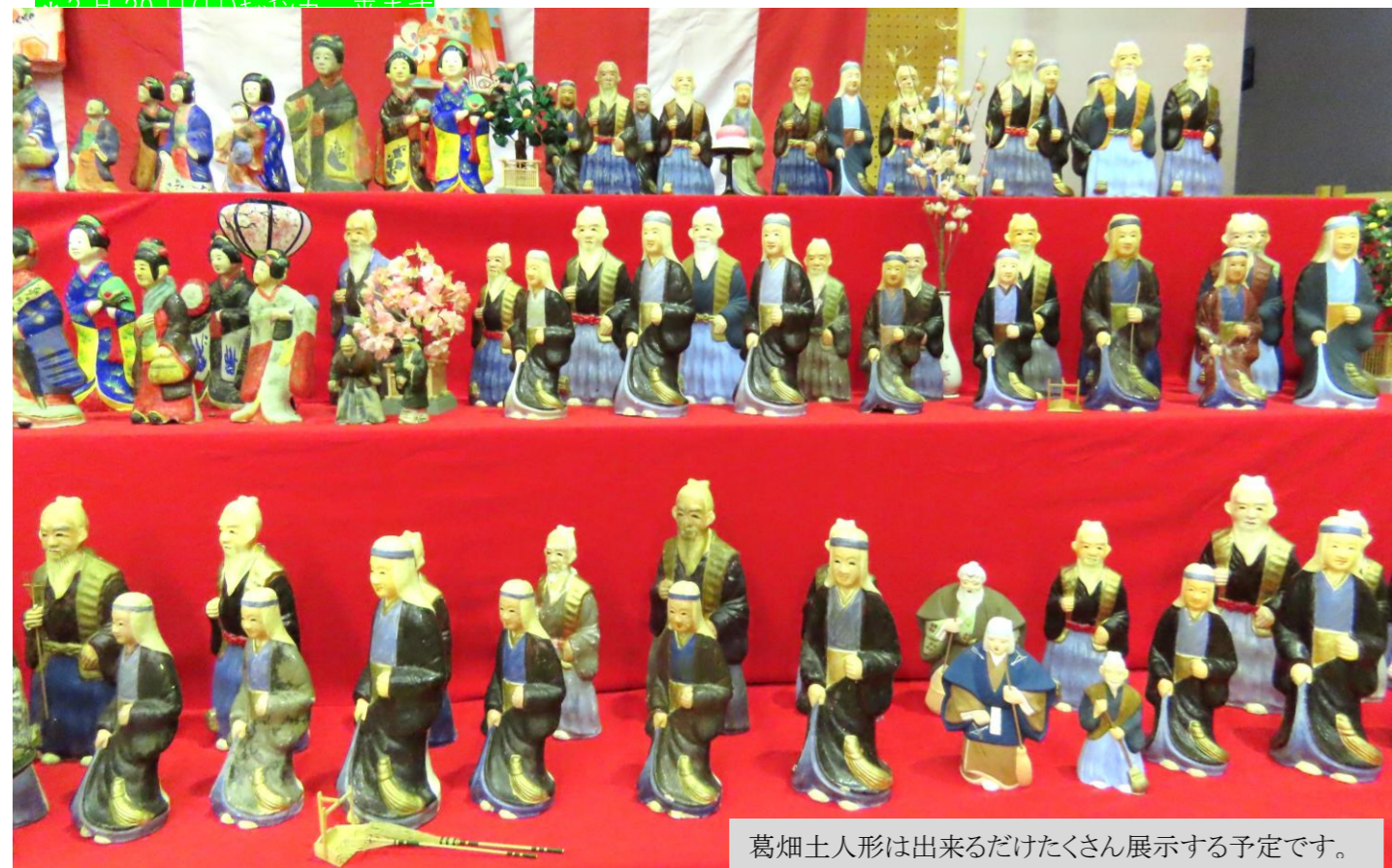
葛畑土人形は出来るだけたくさん展示する予定です。